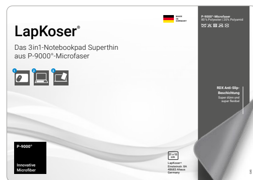
Ansicht der fertigen Einlegekarte