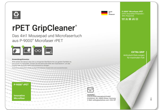
Ansicht der fertigen Einlegekarte