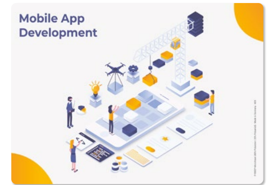
Ansicht des fertigen Displaytuchs

— = Druckfläche 306 x 206 mm inkl. 3 mm Beschnittzugabe