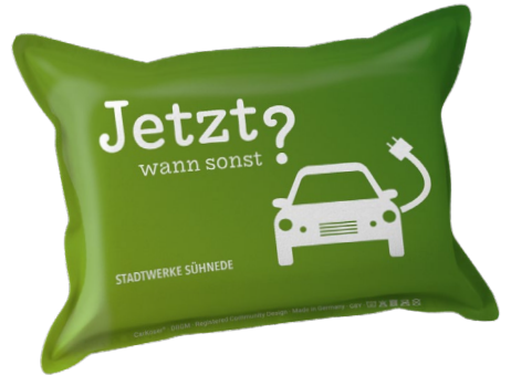
Ansicht des fertigen CarKoser®

• Wir empfehlen diese Angabe aufgrund der Textilkennzeichnungsverordnung.