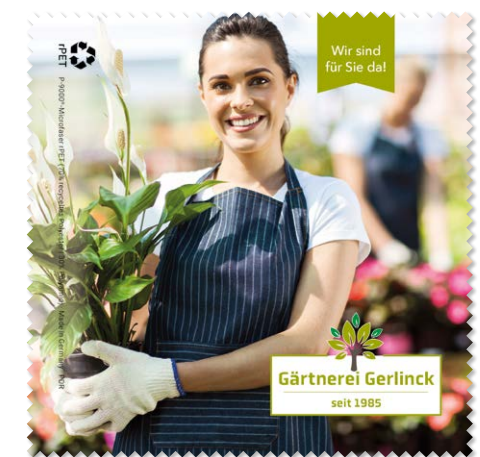
Ansicht des fertigen Brillentuchs