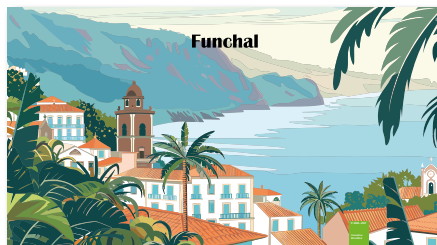
Ansicht des fertigen rPET ActiveTowel® Sports

! Aufgrund technischer Gegebenheiten im Druckprozess, wie Druckstandschwankungen und Schneidtoleranzen (+/- 7 mm), kann der erstellte Rahmen nicht immer parallel zum Rand des Tuchs verlaufen. Es kann daher vorkommen, dass die Ränder unterschiedliche Breiten haben, z.B. 8 mm auf der linken Seite und 12 mm auf der rechten Seite.