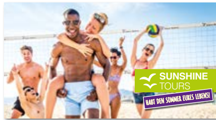
Ansicht des fertigen ActiveTowel ® Sports