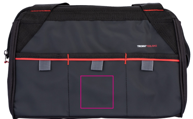
Abbildung oben 1:1

Werkzeugtasche mit Tragegriff, breite Öffnung durch versteiften Reißverschluss, geräumiges Hauptfach mit 6 Stecktaschen, Front: 3 Stecktaschen mit 3 Stiftschlaufen, Tragkraft bis zu 10 kg, Kapazität ca. 6,5 Liter, widerstandsfähiges Material, abwaschbar, Tarpaulin (Plane), rot/schwarz