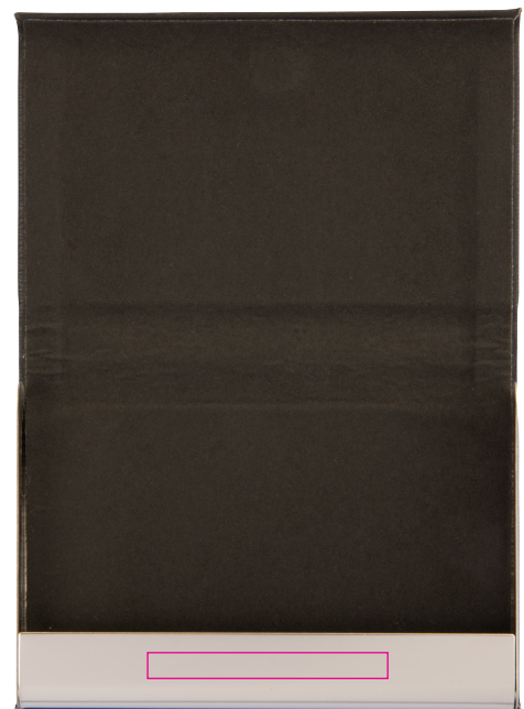
Abbildung oben 1:1

Werbeanbringungsart: Gravur Farbe Werbeanbringung: silberfarben Artikelmaße: 95 x 64 x 14 mm Maße Werbeanbringung: 45 x 5 mm