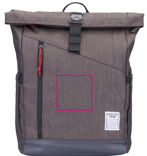
Abbildung oben 1:1

Roll Top Rucksack mit Steckverschluss aus Metall, Hauptfach mit Reißverschlussfach und 2-fach unterteiltem Einschubfach mit Klettverschluss, inkl. Geheimfach für mini Tracking-Geräte (z.B. APPLE AirTag ® ), Fronttasche mit Reißverschluss, 2 Seitentaschen, rückseitiges Geheimfach, gepolsterte Schultergurte, Schlaufe zur Befestigung am Trolley, abgesetzter Standboden, Kapazität ca. 15 Liter, Tragkraft bis zu 15 kg, 100% Polyester, Polyester, anthrazit/schwarz